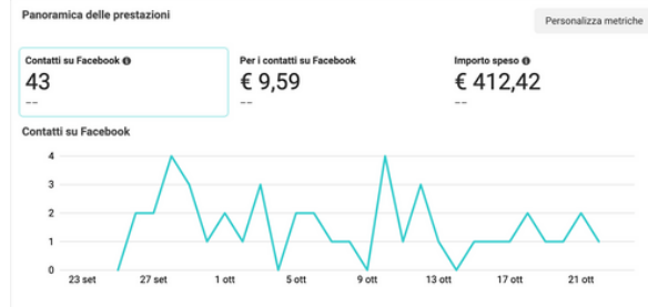
Campagna numero 2

Le campagne hanno performato seguendo questa linea crescente di risultati fino a giugno 2023; Grazie all'apprendimento delle campagne, siamo riusciti ad arrivare ad un RISULTATO STRAORDINARIO: